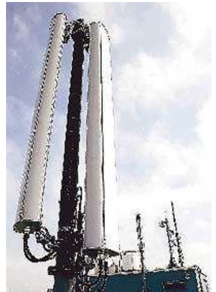
Immer neue Mobilfunkantennen wachsen in den Himmel: Viele Anwohner fürchten sich vor der Strahlung.

Obwohl die Ergebnisse noch nicht veröffentlicht sind, sickerten inzwischen Details der Studie durch: Danach führten elektromagnetische Schwingungen zu Einzel- und Doppelstrangbrüchen der DNA - dem genetischen Code des Menschen. "Gefährlich sind vor allem die Doppelstrangbrüche, weil sie vom Körper oft falsch repariert werden", sagt Adlkofer. Außerdem machten die Forscher eine erstaunliche Entdeckung: Sind Zellen bereits geschädigt, wird dies durch den Einfluß der Strahlung um ein Vielfaches verstärkt.